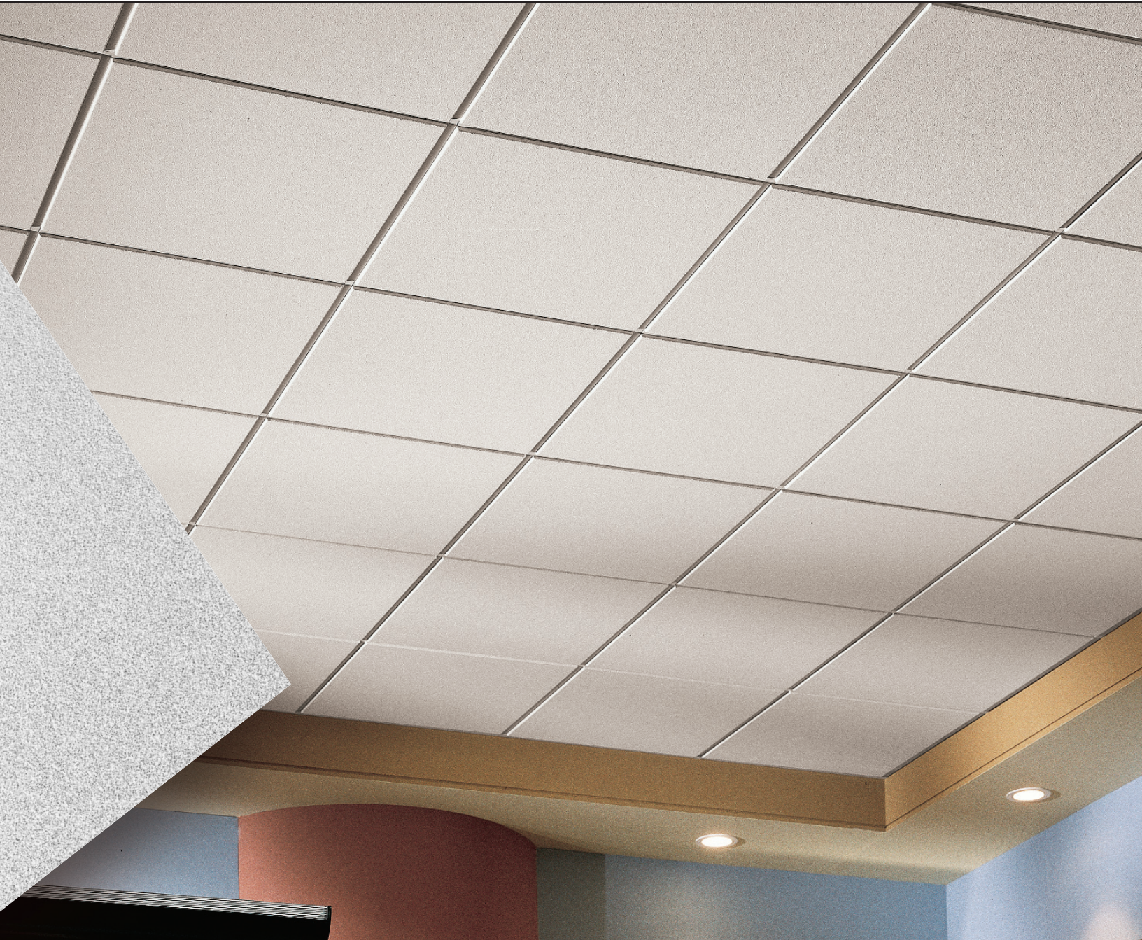
ULTIMA Beveled Tegular com sistema de perfil SUPRAFINE® tipo "T" com face de 14mm